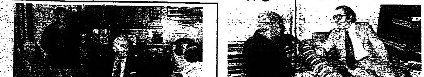
استقبل الرئيس صائب سلام في منزله أمس، السيد وليد صلاح سخر الارن في لبنان بمناسبة عودته من بيروت... في الصورة الرئيس سلام يتبادل الحديث مع السيد صلاح

مهلة الاسبوع التي اعطاها التحالف الكتلتي خلال اجتماعه اول امس في منزل العميد ريمون اده... في الصورة الرئيس سلام يتبادل الحديث مع السيد صلاح